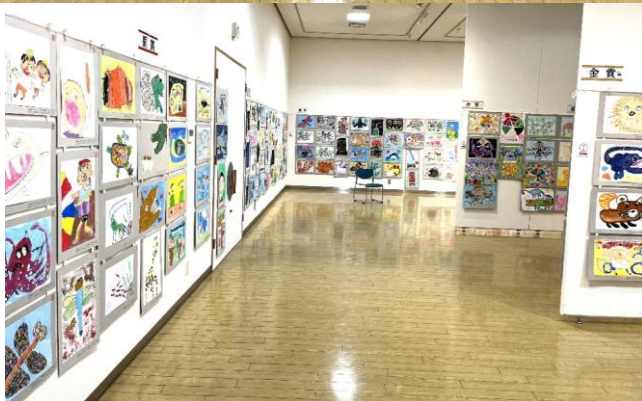
中央展(鹿沼市文化活動交流館)