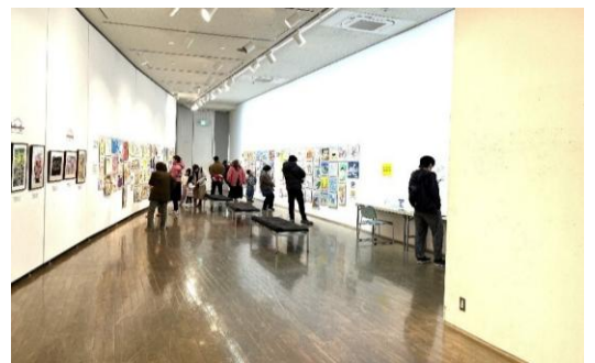
県北展(那須野が原ハーモニーホール)