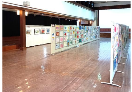
県東展(久保講堂記念館)