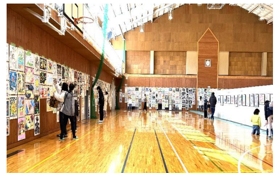
県北展（大田原市ふれあいの丘）