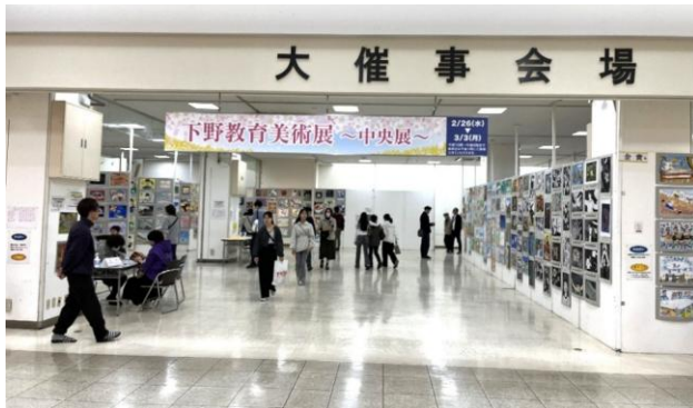
中央展（FKDインターパーク店 大催事会場）